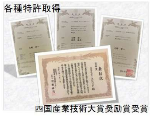
四国産業技術大賞奨励賞受賞